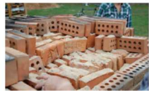
...afbreken van de oven na de stook met door leerlingen gemaakte stf met initialen