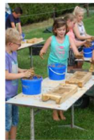
...extra kneden met de handen en vormbak vullen om eigen steen te maken