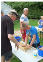
...eigen steen vormen