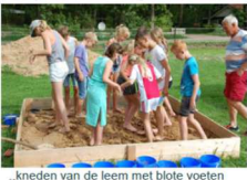
...kneden van de leem met blote voeten